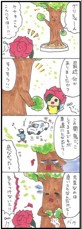
by 南雲風助(なぐもふうすけ)

少年団からのお知らせ <全員集合会のお知らせ> 開催日: 10月18日(土) 雨天: 19日(日) 時間: 午前8時20分~ 場所: 氷丘南小学校運動場