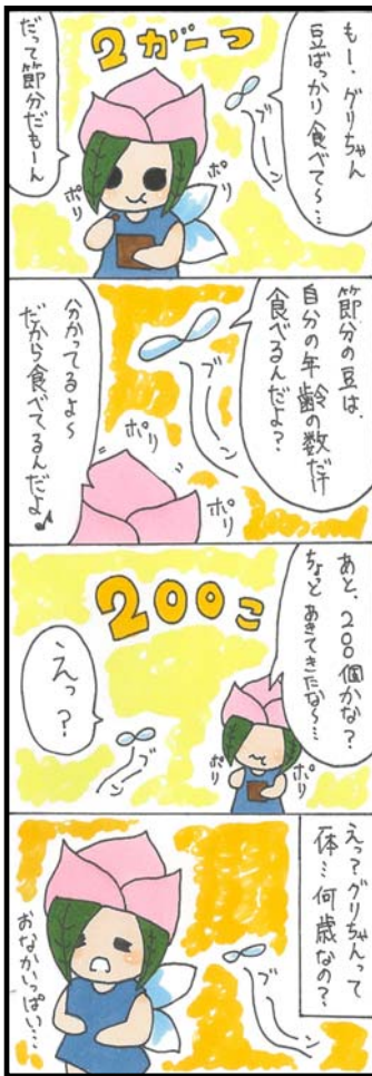
by 南雲風助(なぐもふうすけ)