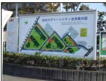
西側チェーンゲート前(更新)