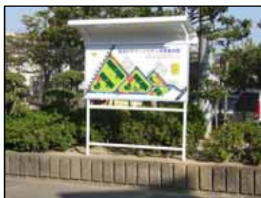
来客駐車場精算機横(更新)