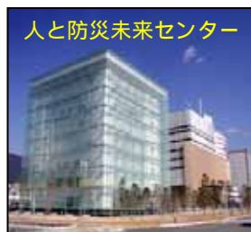
人と防災未来センター